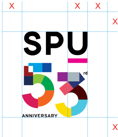
ตราสัญลักษณ์หลัก