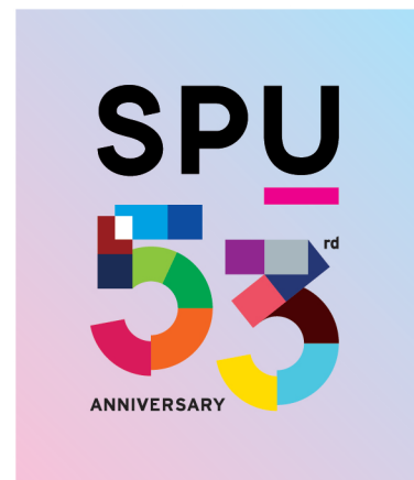
อนุญาตให้ใช้บนพื้นสีอ่อน