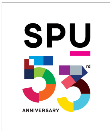
อนุญาตให้ใช้บนพื้นสีขาว