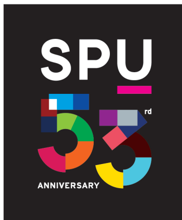
อนุญาตให้ใช้บนพื้นสีดำ กลับดำเป็นขาว